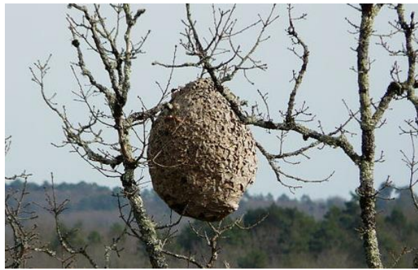
Nest in Baumkrone