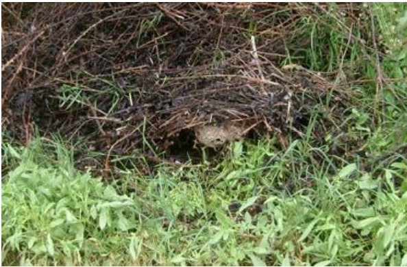
Vornest im Frühling

Die Asiatische Hornisse verbreitet sich seit 2005 invasiv über Südfrankreich in die angrenzenden Nachbarländer. Es gab bereits mehrere Insektenfunde im Aargau. Es ist davon auszugehen, dass sich die Asiatische Hornisse in Europa und auch der Nordwestschweiz weiter ausbreiten wird.